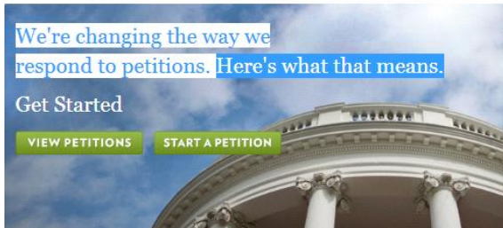
図 3 請願サイト We the People