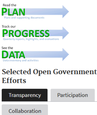
図 2 環境保護庁 (EPA) のデジタル戦略サイト

環境保護庁 (EPA) のデジタル戦略サイトは図 2 に示すようにオープンガバナメントとデジタルガバナメントを表示している。